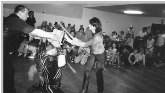
Ředitelka a Železný Zekon