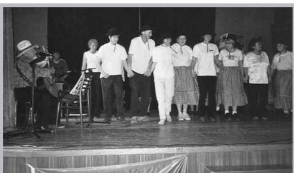
Vystoupení v Hranicích na Moravě