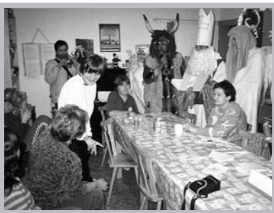
Mikuláš ve Stacionáři