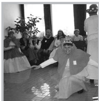
Karneval v ČCE