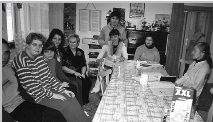
Klienti při besedě s psychologkou a logopedkou