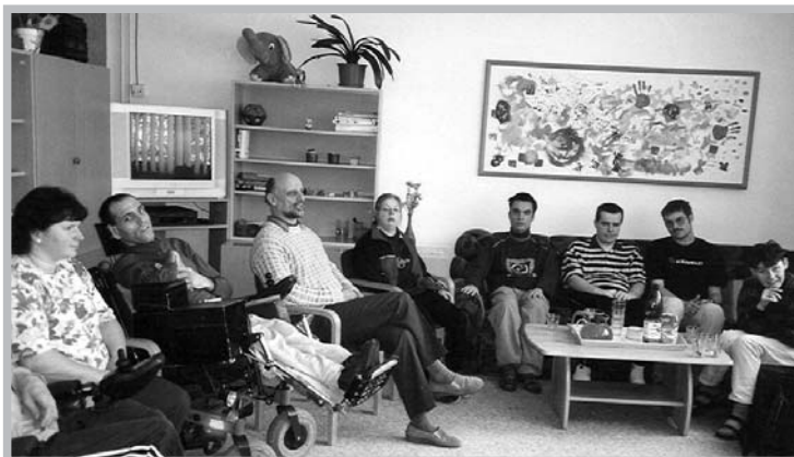
Exkurse ve stacionáři Agapé v Letovicích

Uživatelé Domova se mohli i v tomto roce zúčastnit mnoha akcí: výletů, exkurzí do jiných zařízení, kulturních vystoupení, pobytů aj. Na ukázkou pár fotografií z několika zajímavých akcí.