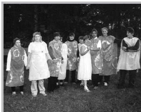
Vystoupení v Kelči