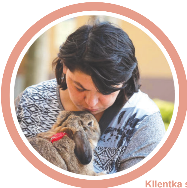
Klientka s králíčkem