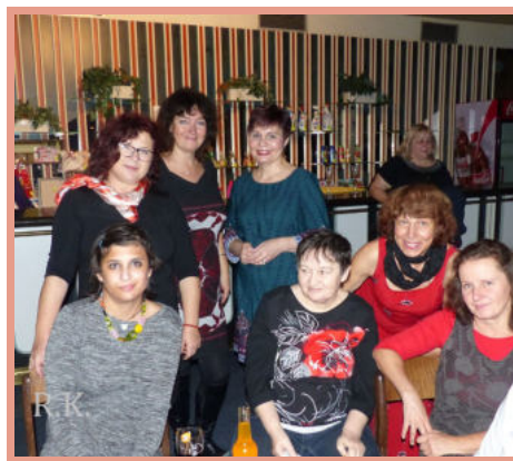
Country Večer 2019