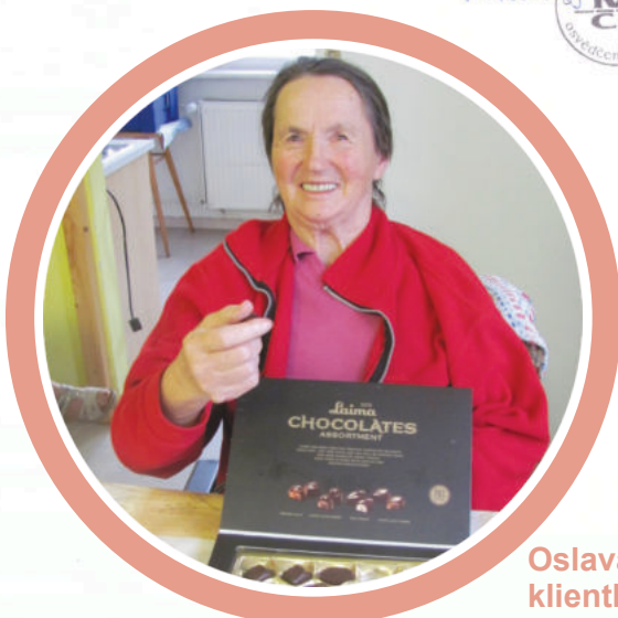
Oslava 90. narozenin klientky