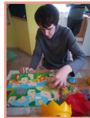
• Pomoc pečující rodině

Celkem službu využilo 11 klientů z těchto lokalit: Vsetín, Zlín, Bystřička, Hovězí, Kopřivnice, Jablunka.. Kapacita byla využita během roku na 97 %.