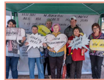
Veletrh NNO, Nový Hrozenkov