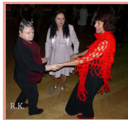
Ples SPOLEČNĚ 2019